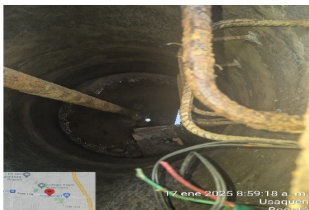
Foto No. 4 Pozo pz-01-0025

La boca del pozo se sitúa dentro de una estructura de concreto aproximadamente a 3 metros de la superficie, es considerado de naturaleza saltante, pero para el momento de la visita no se evidenció afloramiento de agua, según lo informado por el usuario el punto de captación de aguas subterráneas colapso hace aproximadamente 2 meses, razón por la cual procedieron a retirar la bomba (Foto No. 4). En el lugar se observa, además llave de paso, derivación para toma de muestras, sistema hidráulico (Foto No. 5), placa de identificación (Foto No. 6) y equipo de medición de caudal marca Eister con numero de serial JI7JE001692C y lectura acumulada de 1838 m 3 (Foto No. 7).