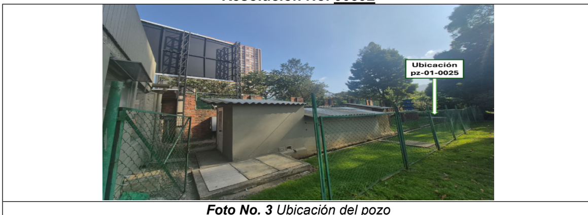
Foto No. 3 Ubicación del pozo

La boca del pozo se sitúa dentro de una estructura de concreto aproximadamente a 3 metros de la superficie, es considerado de naturaleza saltante, pero para el momento de la visita no se evidenció afloramiento de agua, según lo informado por el usuario el punto de captación de aguas subterráneas colapso hace aproximadamente 2 meses, razón por la cual procedieron a retirar la bomba (Foto No. 4). En el lugar se observa, además llave de paso, derivación para toma de muestras, sistema hidráulico (Foto No. 5), placa de identificación (Foto No. 6) y equipo de medición de caudal marca Eister con numero de serial JI7JE001692C y lectura acumulada de 1838 m 3 (Foto No. 7).