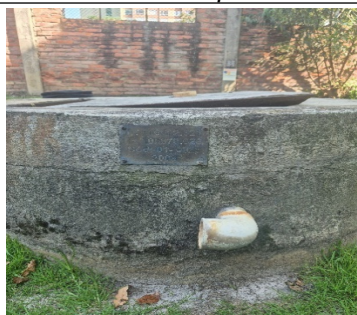
Foto No. 6 Placa de identificación