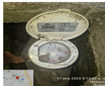
Foto No. 7 Equipo de medición automática